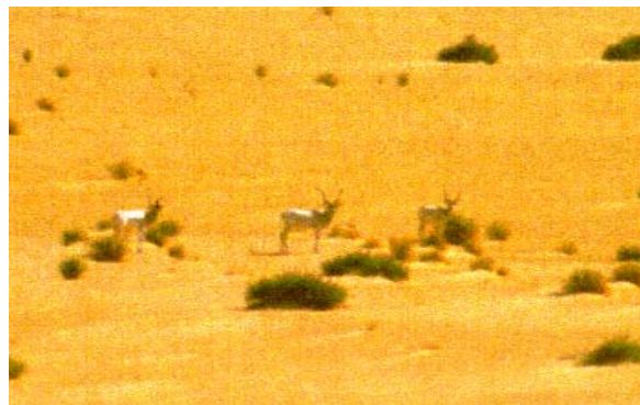
addax adultes en alerte

L'addax est une des plus grandes antilopes encore présente dans la région Saharienne. C'est une espèce déclarée en danger en voie d'extinction en 1988 (IUCN, 1988) disparue du Maghreb et du Sahara occidental. Son aire de distribution est fort malheureusement morcelée, formée de noyaux disséminés de l'Atlantique au Nil.