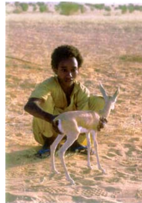
Jeune gazelle dorcas

La gazelle dorcas peut être considérée comme l'espèce la mieux représentée de tous les ongulés des zones désertiques et subdésertiques. La densité semble cependant beaucoup plus importante au Sud de Tesker à Termit, moyenne dans le massif et faible à très faible au delà.